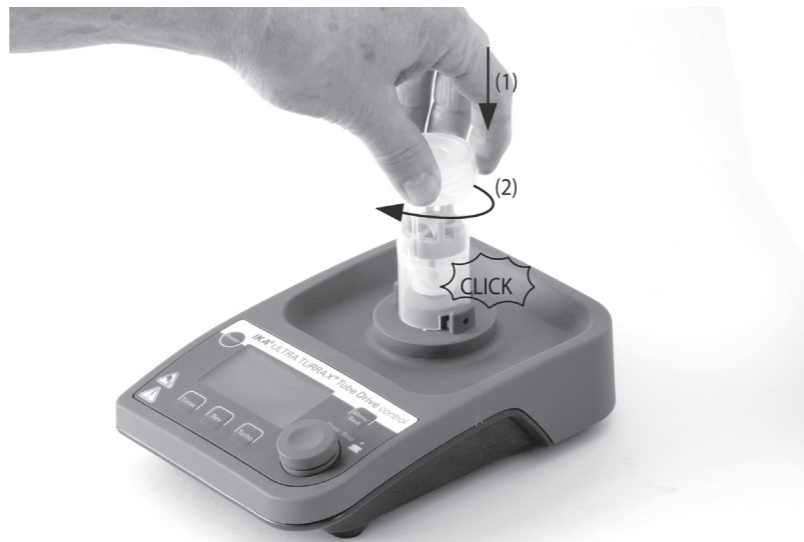
St-2 - Tube aufstecken • Put on the St-2 - Tube • Mettre le St-2 - Tube • Установка пробирки St-2

В соответствии с условиями продажи и поставки компании IKA® срок гарантии составляет 24 месяца. При наступлении гарантийного случая просим обращаться к продавцу или отправить прибор с приложением платежных документов и указанием причины рекламации непосредственно на наш завод. Расходы по перевозке берет на себя покупатель. Гарантия не распространяется на изнашивающиеся детали, случаи ненадлежащего обращения, недостаточного ухода и обслуживания, не соответствующего указаниям настоящей инструкции по эксплуатации.