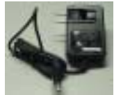
AC Power Adapter